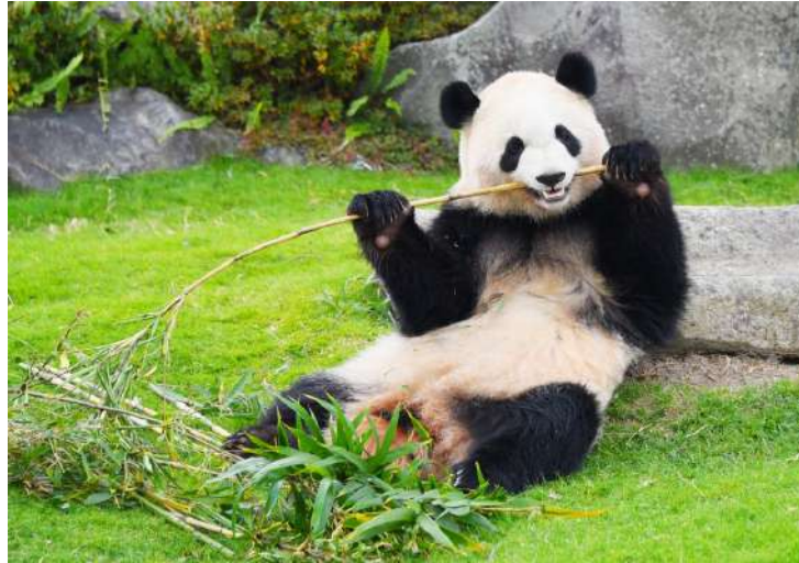
ジャイアントパンダ「彩浜（さいひん）」

アドベンチャーワールド（和歌山県白浜町）では、2021年3月14日（日）のホワイトデーに、2歳のメスのジャイアントパンダ「彩浜（さいひん）」をはじめ4頭のパンダへ日頃の感謝を込めてプレゼントを贈ります。