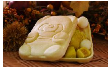
「たっぷり秋もなか」 500円 販売店舗：ラシュレ