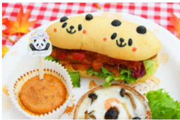
「親子パンダの幸せホットドッグプレート」 1,350円 販売店舗：パン工房