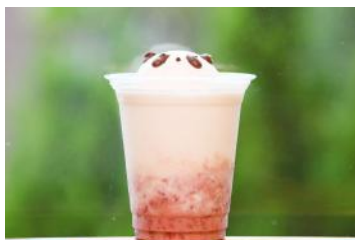
「パンダのいちごミルク」 400円 販売店舗：キッチン