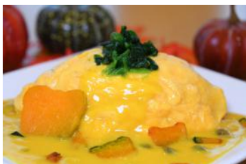
「ほっこりかぼちゃのオムライス」 1,000円 販売店舗：キッチン