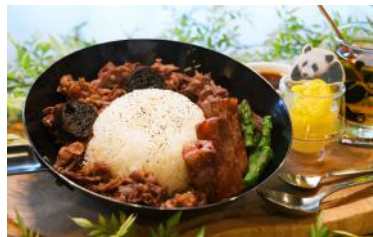
「パンダフェスランチ」 3,490円 販売店舗：Jambo