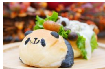
「パンダのチーズドッグ」 800円 販売店舗：ヒポバーガー