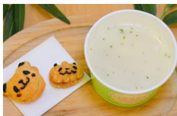
「パンダたちの男爵いもスープ」 500円 販売店舗：マリブルー