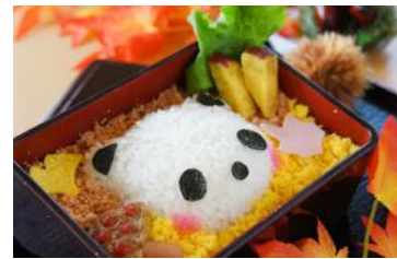
「ハッピーパンダ重」 1,000円 販売店舗：マアム