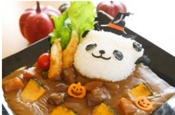
「ハロウィンカレー～パンダの魔法使い～」 1,200円 販売店舗：マルシェ