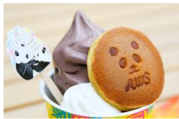
「パンダ×あずきソフト」 550円 販売店舗：マリブルー2