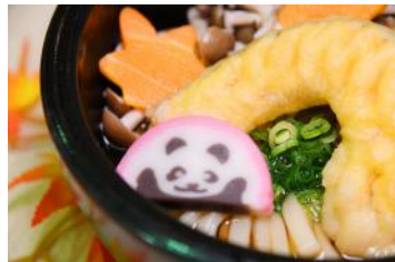
「秋の味覚うどん」 1,000円 販売店舗：サムズ