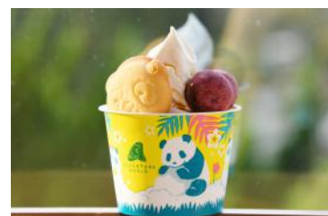
「おさつボールサンデー」 600円 販売店舗：レインボー