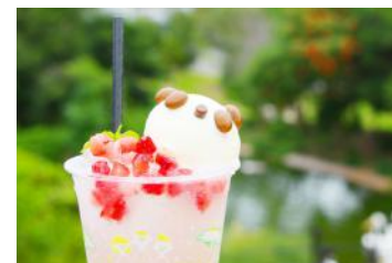
「パンダのぶどうフロート」 540円 販売店舗：ヒポバーガー