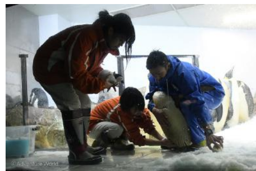
※親鳥のもとへ返す様子