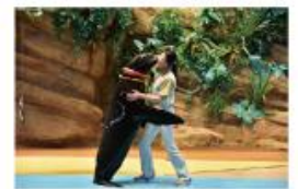
遠い昔から一緒だった 海からのやさしい贈り物に出会う