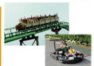
型にこだわらない遊びがまっている