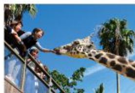
野生を感じる、自然からの 熱いメッセージに目を傾ける、ひととき