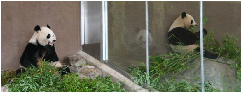
ふたごの「桜浜」・「桃浜」も別々の運動場で過ごします。

ジャイアントパンダのように、単独生活する動物の親子が別れる時期は突然訪れます。母親は突然子どもに対する態度を変え、攻撃的になり、自分の縄張りから追い出し、ひとり立ちを促すようになります。野生下では子は母親から逃げるように旅立っていきますが、アドベンチャーワールドのような飼育下では、逃げられる範囲に限りがあります。子は逃げ場を失い致命傷を負ってしまうことも考えられるため、親子の安全を最優先に段階的にひとり立ちをサポートする必要があります。