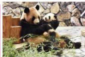
新たな出会いと感動の空間 パンダファミリーに感動の大接近