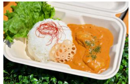
みかん鶏のバターチキンカレー