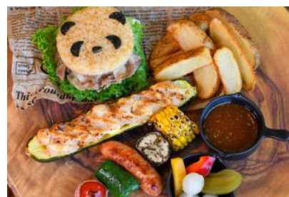
ごろっと夏野菜とパンダライスバーガー