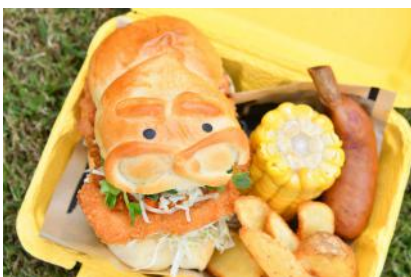
カレーチキンバーガーのキャンプボックス