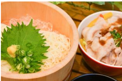
そうめんミニ冷しゃぶ丼セット