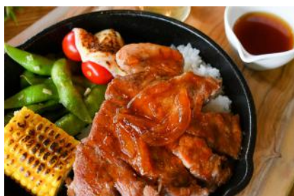
イブ美豚と彩野菜のサマーランチ