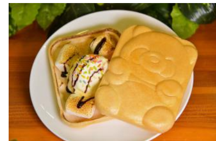
スモア風アイスもなか