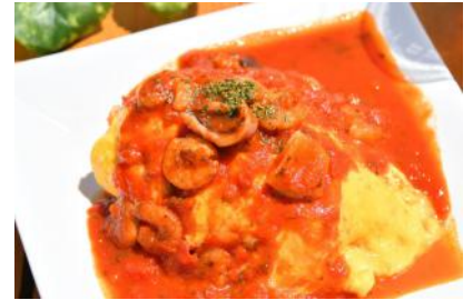
トマトソースのシーフードオムライス