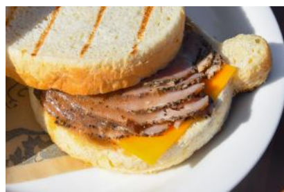
パストラミポークサンド