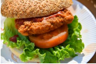
ガーリックチキンバーガー