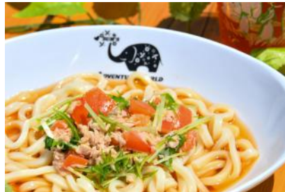
イタリアン風冷やしぶっかけうどん