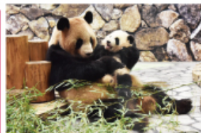
新たな出会いと感動の空間 パンダファミリーに感動の大接近