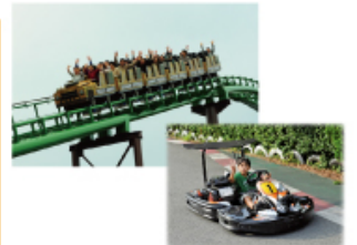
型にこだわらない遊びがまっている