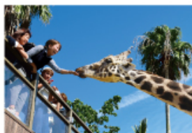
野生を感じる、自然からの 熱いメッセージに耳を傾ける、ひととき