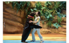
遠い昔から一緒だった 海からのやさしい贈り物に出会う