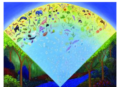
生命誌絵巻（JT生命誌研究館）

「生命誌」とは、人間も含めてのさまざまな生きものたちの「生きている」様子を見つめ、そこから「どう生きるか」を探る新しい知です。地球上の生きものたちは38億年前の海に存在した細胞を祖先とし、時間をかけて進化し多様化してきた仲間です。すべての生きものが細胞の中に、それぞれが38億年をどのように生きてきたかの歴史をしるすゲノムDNAを持っています。ゲノムDNAは、壮大な生命の歴史アーカイブです。その歴史物語を読み解き美しく表現することで、生きものの魅力を皆で分かち合い、生きることについて考えていく場が「研究館」“Research Hall”です。