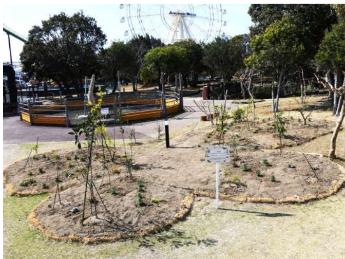
チョウのファミリーレストラン

3月25日（土）・26日（日）JT生命誌研究館の昆虫学者によるレクチャーイベントを開催