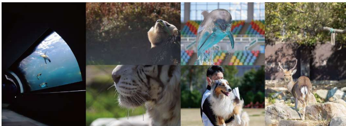
第3回イベント参加者の撮影写真