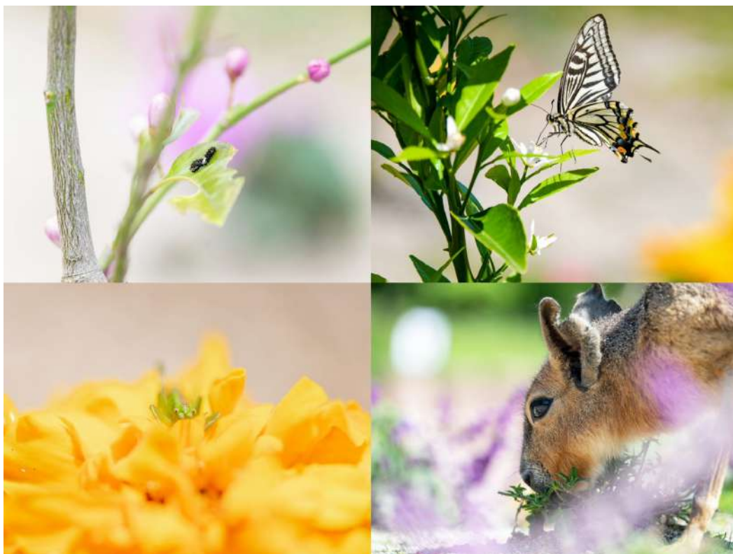
JT生命誌研究館監修パーク内食草園 チョウのファミリーレストランにて撮影

アドベンチャーワールド（和歌山県白浜町）は、6（む）月4（し）日（日）～8月29日（火）の期間、JT生命誌研究館（大阪府高槻市紫町1-1）監修のパーク内食草園を訪れた小さな生命（いのち）を撮影した、 つながりを見つめる写真展「チョウのファミリーレストランで出会う小さな生命（いのち）」 を開催いたします。食草園で虫たちの訪れを待つ色鮮やかな植物と虫たちの関係や世代の移り変わり、命の美しさを見つめ、新たな魅力を発掘する場となることを願い、皆様のお越しをお待ちしております。