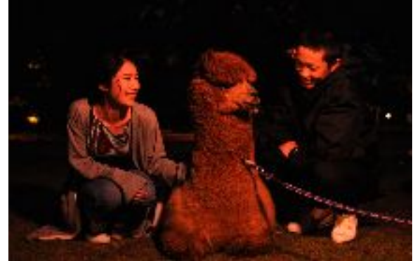
ナイトアニマルfeels (イメージ)