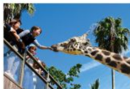
野生を感じる、自然からの 熱いメッセージに目を傾ける、ひととき