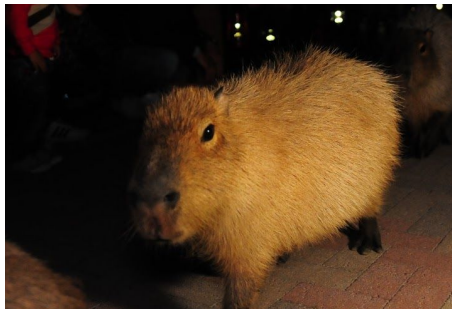
カピバラウォーキング