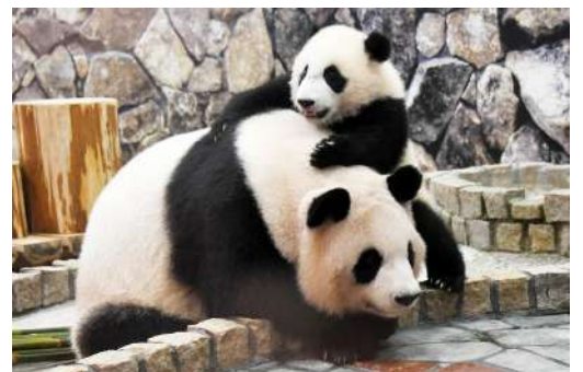
「良浜」とじゃれ合う「良浜」 (「良浜」218日齢)