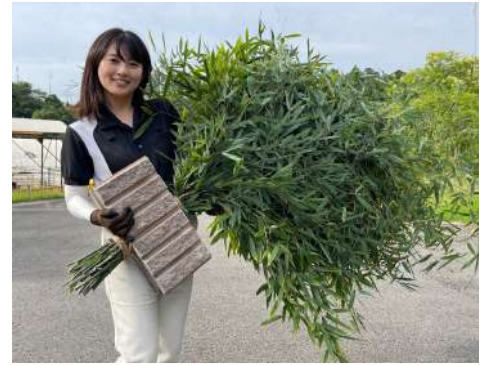
竹(孟宗竹)の産卵床