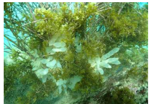
昨シーズン（2023）産み付けられた卵と 竹に着生した海藻