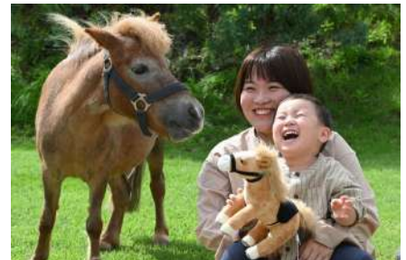
ウマ（ミニチュアホース）との撮影イメージ

【アドベンチャーワールド「SDGs宣言・パークポリシー」】 https://www.aws-s.com/parktheme-sdgs/