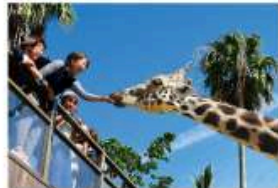
野生を感じる、自然からの 熱いメッセージに目を傾ける、ひととき