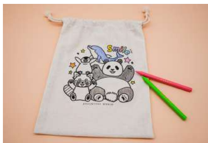
・オリジナルシールブック