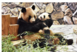
新たな出会いと感動の空間 パンダファミリーに感動の大接近