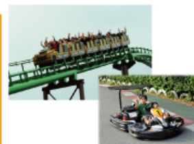
型にこだわらない遊びがまっている