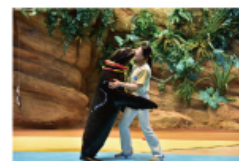
遠い昔から一緒だった 海からのやさしい贈り物に出会う