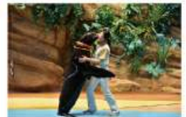
遠い昔から一緒だった 海からのやさしい贈り物に出会う