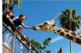
野生を感じる、自然からの 熱いメッセージに耳を傾ける、ひととき