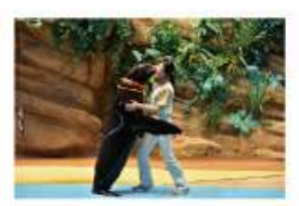
遠い昔から一緒だった 海からのやさしい贈り物に出会う