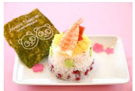
彩りちらし寿司 （販売店舗：サムズ）