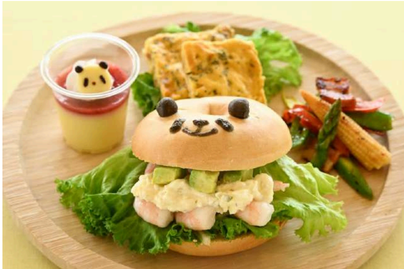
エビとアボカドのベグルサンドプレート（販売店舗：パン工房）

アドベンチャーワールド（和歌山県白浜町）では、3月20日（木・祝）から5月31日（土）までの期間、春のアドベンチャーワールド「SPRING ADVENTURE 2025」を開催いたします。「春のグルメアドベンチャー2025」では、パーク内レストラン14店舗でこの春だけの特別なグルメが登場します。和歌山県産の新鮮な食材を贅沢に使用し、彩り豊かで味わい深い料理やスイーツをご用意しました。春の訪れを感じながら、アドベンチャーワールドならではの特別な食体験をお楽しみください。