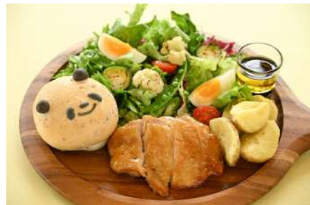
てりやきサラダプレート （販売店舗：Smile Kitchen）