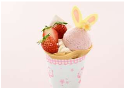
味いいちごのうささくレーブ （販売店舗：レオーネ）