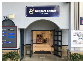
サポートセンター