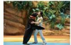
遠い昔から一緒だった 海からのやさしい贈り物に出会う