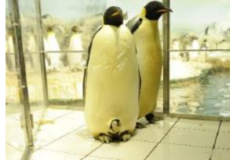
2013年誕生の赤ちゃん