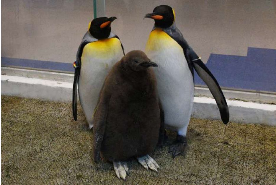
4月12日撮影 母親と育ての父親と 過ごす赤ちゃん

アドベンチャーワールド（和歌山県白浜町）は近畿大学生物理工学部（和歌山県和歌山市）および先端技術総合研究所（和歌山県海南市）との共同研究において、昨年につき2年連続でキングペンギンの人工授精に成功しました。2021年2月6日に誕生した赤ちゃんはDNA鑑定の結果、精子を提供したオスの遺伝子を持つことがわかりました。今回の成功は国内3例目（3羽目）となります。現在赤ちゃんは母親と育ての父親とともにペンギン王国で元気に過ごしています。