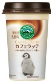
アドベンチャーワールド エンペラーペンギン