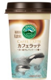
鴨川シーワールド シャチ