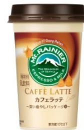
おたる水族館 フウセンウオ