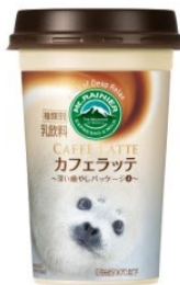
おたる水族館 ゴマフザラシ(モモたろう)