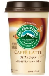
登別マリンパークニクス カクレクマミ