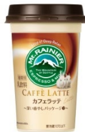
伊豆アニマルキングダム ウサギ