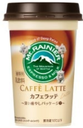
伊豆アニマルキングダム ホワイトタイガー(パニラ/メレンゲ/ホイップ)