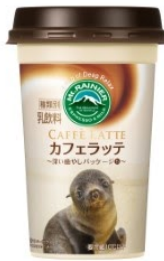
登別マリンパークニクス ミナミアメリカオットセイ(チー)