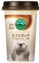
鳥羽水族館 ラッコ(メイ)