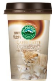
神戸どうぶつ王国 スナネコ(マフ)