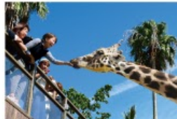
野生を感じる、自然からの 熱いメッセージに耳を傾ける、ひととき