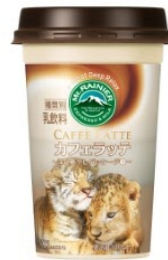
アフリカンサファリ トラ(パール)/ライオン(ふさころう)