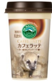
伊豆シャボテン動物公園 アカハグマ