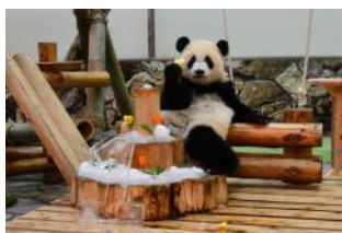
2019年8月14日 1歳の誕生日