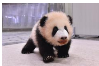
2018年12月10日 歩き始める