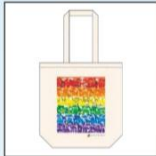
オーガニックコットン キャンバーストート M