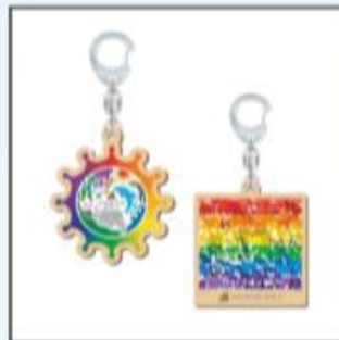
木製キーホルダー (和歌山県産ヒノキ間伐材使用)