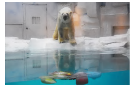
プレゼントイメージ