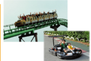
型にこだわらない遊びがまっている