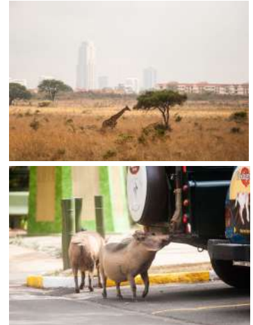
ケニアで暮らす野生動物の様子

アフリカといえば、大自然を連想する人が多いかもしれません。世界最長のナイル川、キリマンジャロのような高い山、世界三大瀑布に数えられるヴィクトリアの滝、世界で2番目に大きい淡水湖のヴィクトリア湖、数々の美しいビーチや森林など、アフリカは大自然と生態系の宝庫です。しかし、アフリカの魅力は大自然だけではありません。多様な民族がもつ独自の文化、ファッション、アート、おいしい食べ物、音楽や踊り、明るくフレンドリーな人々、そして、動物たち。このようなアフリカを是非知ってください。アフリカの様々な国の現状を知っていただくために、JICA海外協力隊員が撮影した映像や写真を用いてご紹介します。