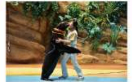
遠い昔から一緒だった 海からのやさしい贈り物に出会う