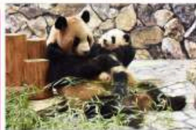
新たな出会いと感動の空間 パンダファミリーに感動の大接近