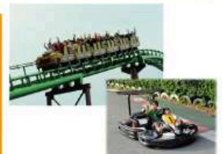
型にこだわらない遊びがまっている