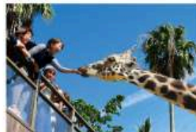
野生を感じる、自然からの 熱いメッセージに耳を傾ける、ひととき