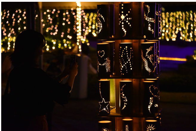
通路の7つの柱を飾る「想いの竹あかり」