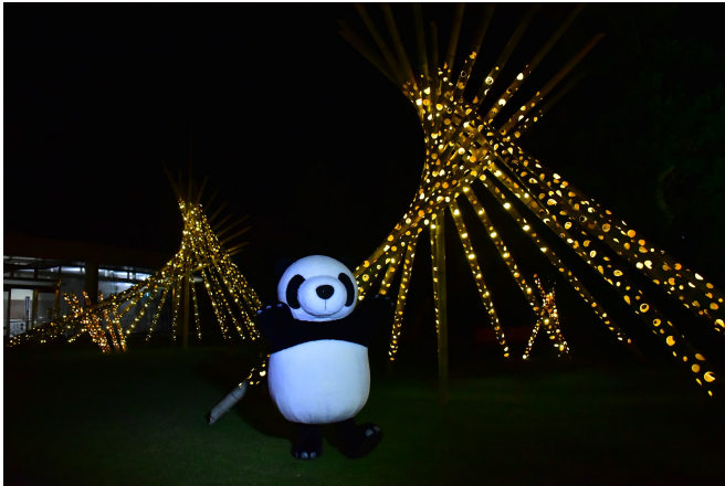
竹あかりの光の回廊「循環の環」