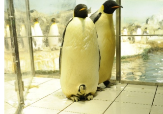
2013年誕生の赤ちゃん