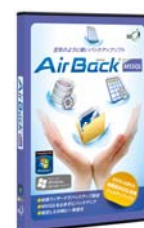
Air Back for PC