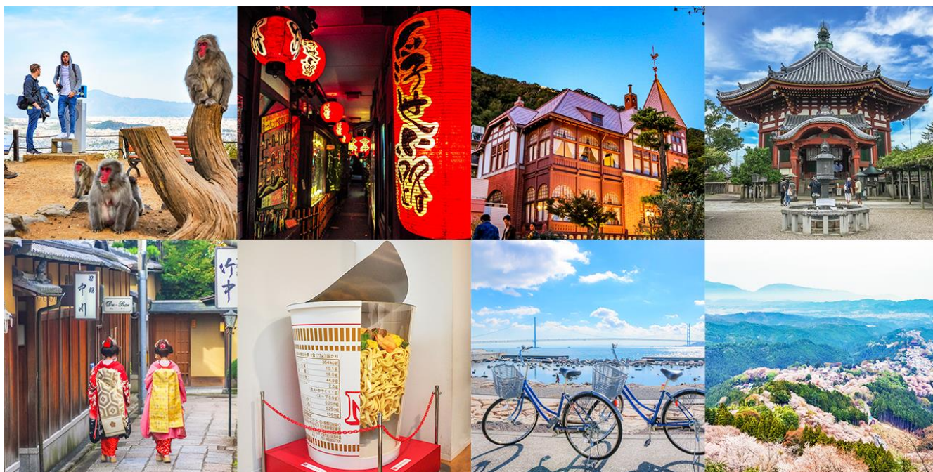
関西圏でのツアープラン風景

当社は、2019年1月にサービスを正式リリースし、関東圏で400名以上のガイドにご登録いただき、150種類以上のツアープランでプライベートツアーを提供してきました。関西圏はインバウンド旅行者の人気が高く、大阪府は全国第2位、京都府は全国第4位の訪問率* 1 となっています。このたびサービスの更なる利便性向上を図るため、関西圏にサービスの提供エリアを拡大することになりました。2019年3月より関西圏でのガイド登録の受付を開始し、2019年6月よりツアーの予約受付を開始します。