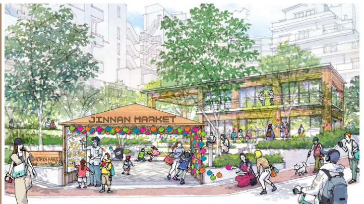
「どんな公園をつくりたい？」ワークショップの様子