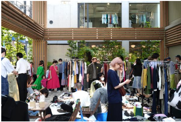
JINNAN MARKET 過去開催の様子

これまで様々なトレンドやカルチャーが生まれてきたファッションと音楽の街・神南エリアから新たにスタートする、地域連携型カルチャーイベントをぜひお楽しみください。