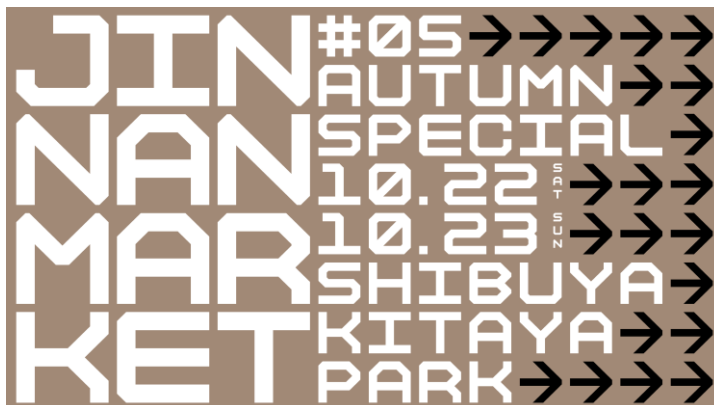
「JINNAN MARKET - Autumn Special -」

株式会社日建設計（本社：東京都千代田区 代表取締役社長：大松敦、以下「日建設計」）が企画運営する「JINNAN MARKET - Autumn Special -」が、10月22日（土）・23日（日）の2日間、神南地域を中心とする11の組織を巻き込んで渋谷区立北谷公園（以下「北谷公園」）にて開催されます。これまで定期的に行ってきた地域連携イベント「JINNAN MARKET」のスペシャル版として、ファッションを中心にシネマ、フード、ミュージック、アート、フィットネス、テックといった7ジャンルのコンテンツを準備するほか、目玉企画として「北谷公園でやりたいこと」で公園を彩る企画「『どんな公園をつくりたい？』ワークショップ」を実施。より多くの人々が、公園を使った新しい体験を楽しめるイベントです。