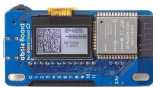
スリープ機能付き 『obniz Board 1Y』

https://obniz.com/ja/products/obnizboard