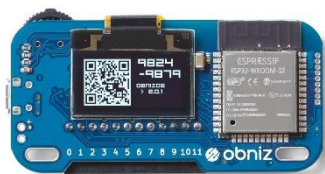
IoT用マイコンボード 『obniz Board』