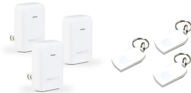
セット内容:『obniz BLE/Wi-Fi ゲートウェイ』とビーコンタグ