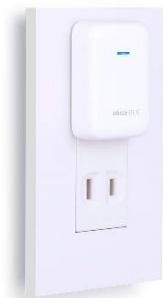
(設置イメージ) コンパクトで清潔感のある 『obniz BLE/Wi-Fi ゲートウェイ』

https://obniz.myshopify.com/products/location-kit