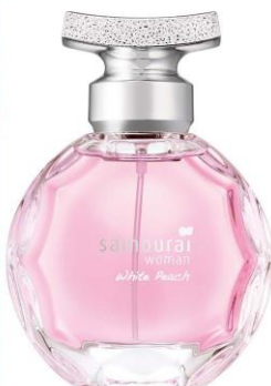
サムライウーマン ホワイトピーチ オードパルファム 容量：40mL 価格：6,600円（税込）