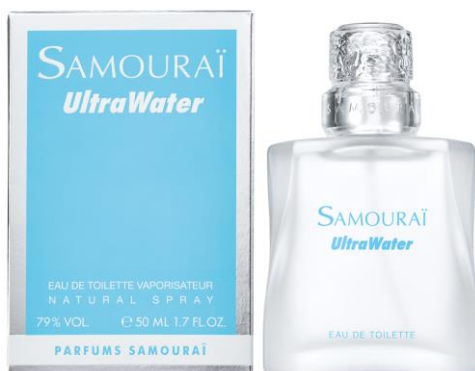
サムライ ウルトラウォーター オードトワレ 容量：50mL 価格：8,250円（税込）