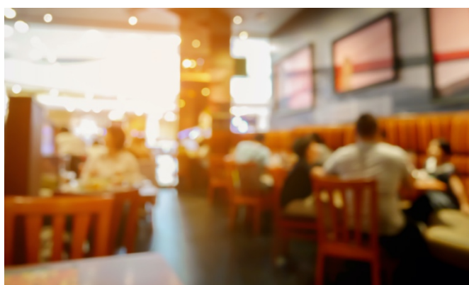
レストランイメージ