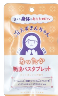
炭酸バスタブレット