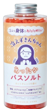
大容量バスソルト