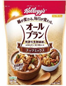
オールブラン ナッツミックス (4月20日発売)

「オールブラン」に含まれるアラビノキシランは、小麦ブラン由来の発酵性食物繊維です。継続的な摂取を続けることで、便秘改善効果はもちろん、善玉菌とよばれる腸内の酪酸菌を増やし、酪酸を増加させることにより腸内環境を改善することが報告されています。