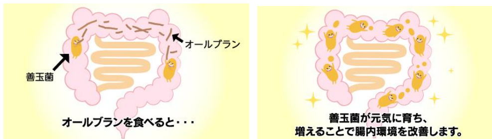
善玉菌のエサとなる「オールブラン」の発酵性食物繊維（アラビノキシラン）