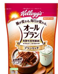
2020年4月 リニューアル新製品