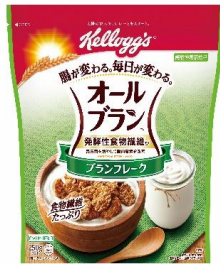
オールブラン ブランフレーク (4月20日発売)