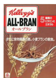
1987年 日本で初めて発売された オールブランシリーズ