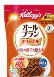
2020年 リニューアル前