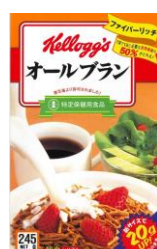
1994年 トクホ（特定保健商品） 表示取得時のパッケージ