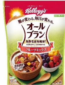
オールブラン フルーツミックス (4月20日発売)