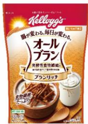
オールブラン ブランリッチ (4月上旬発売)

製品情報はコチラ： https://www.kelloggs.jp/ja_JP/brands/all-bran-consumer-brand.html#num=12