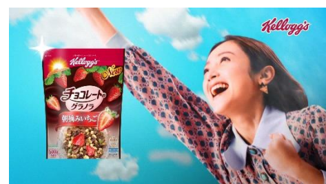
安達:はーはっは NA:ケロッグ チョコレートの グラノラ 朝摘みいちご