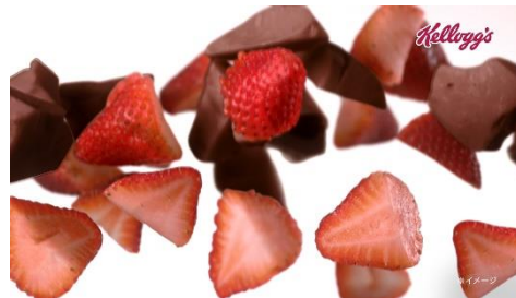
SE:シャンツ NA:イチゴとチョコの ベストマッチで..