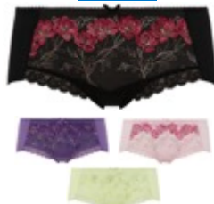
ストリングショーツ