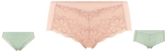
ヒップハンガーショーツ