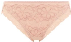
ハイキニショーツ