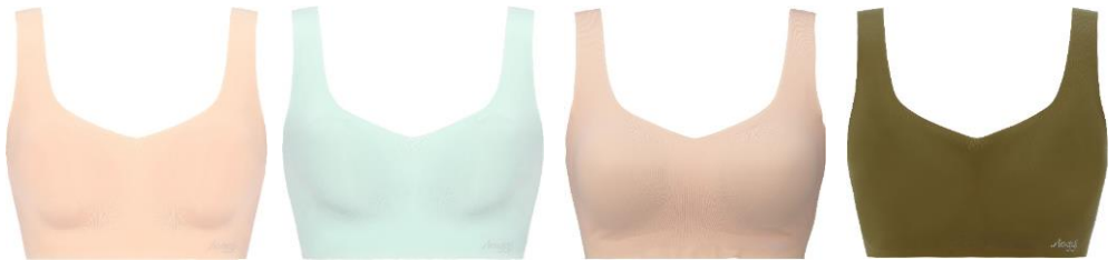
オータムフラワー