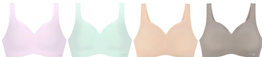
ラベンダーブリーズ