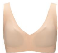
ピーナッツバター