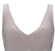
コーヒーシュガー