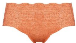
シュガーアーモンド