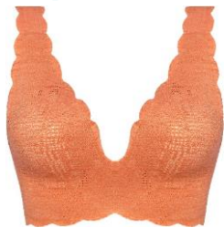
シュガーアーモンド