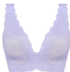
イブニングヘイズ