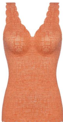
シュガーアーモンド