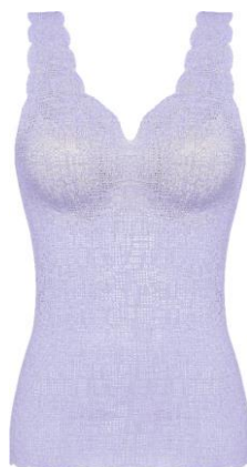
イブニングヘイズ