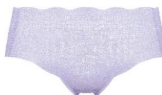
イブニングヘイズ