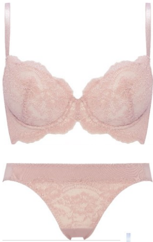
Fit : 3/4カップブラ

繊細なコード調のレースにうっとり。背中までレースをあしらひ、贅沢に仕上げました。肌を美しく見せてくれるヌーディなピンク、透明感のあるブルー、クラシカルなネイビー、ピュアなホワイトレースを重ねたシックなグレーの4色展開です。