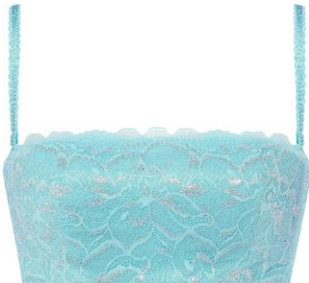
NEW 5月16日(木)発売 AMOSTYLEバンドウ C・D ¥3,960、E ¥4,510 C-E / 65-75 ブルー、オレンジ、グリーン

1枚持っているときやぱり便利なのがストラップレスブラ。「AMOSTYLEバンドウ」は胸元のレースがフェミニンで、アウターとのコーディネートも楽しいシリーズ、さらに通気性のよい素材を使用しているので着けごちが涼やか。「シグネチャースムース ストラップレスハーフカップブラ」は、つるんとカップでひびきにくく、薄手や色の透けの気になるアウターにも大活躍です。