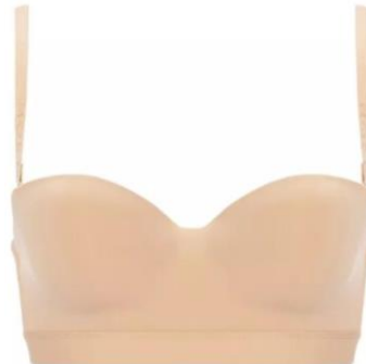
シグネチャースムース ストラップレスハーフカップブラ B-D ¥3,490、E・F ¥3,930 B-E / 65-75、F / 70-75 オレンジ、ベージュ、ブラック