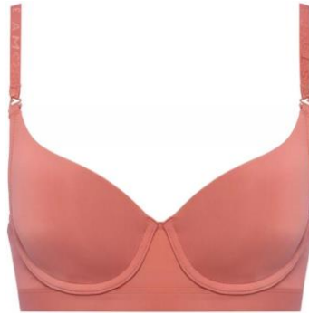
シグネチャースムース シームレスカップブラ B-D ¥3,490、E・F ¥3,930 B-E / 65-75、F / 70-75 オレンジ、ベージュ、ブラック

シンプルでアウターにラインがひびきにくく、デイリー使いしやすいデザインの人気シリーズです。ストレッチ性のあるモールドカップで自然な丸みをつくり、バストにやさしくフィット。サイド～バックパネルにかけて伸びのある素材を使用することで体の動きにフィットし、らくちんな着けごちです。