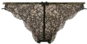
ジャストウエスト

レオパード柄と幾何学模様のレースをあしらった上品でシックな印象のショーツも多彩にラインアップ。素肌がのぞく透け感のあるデザイン、脚口のカット、パイピングを効かせるなどディテールにこだわりました。