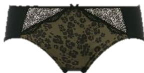
ボーイズレングス