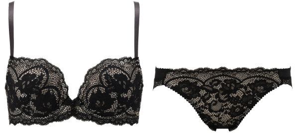
クラシカルレース プッシュアップブラ ブラジャー & ショーツセット ¥5,990～(税込¥6,589～)

見た目のかわいさはもちろんですが、実はアモスタイルの「クラシカルレースシリーズ」と同じレース素材を使用しています。マスク単体でお使いいただくのももちろんのこと、ブラジャー&ショーツとのお揃いコーデもおすすめ！ 見えないからこそ、ロマンティック。自分だけの密かなおしゃれ、楽しんでみてはいかが？