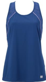
トワイライトブルー