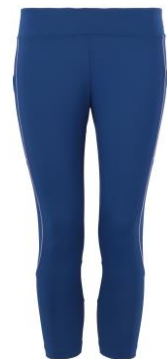
トワイライトブルー