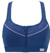
トワイライトブルー