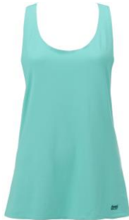
バランスグリーン