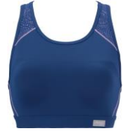
トワイライトブルー